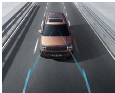
Sistem ohranjanja smeri in sledenja oznakam voznega pasu (LFA 2)