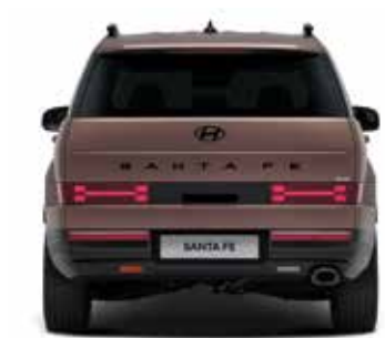
Kolotek zadaj 1.653