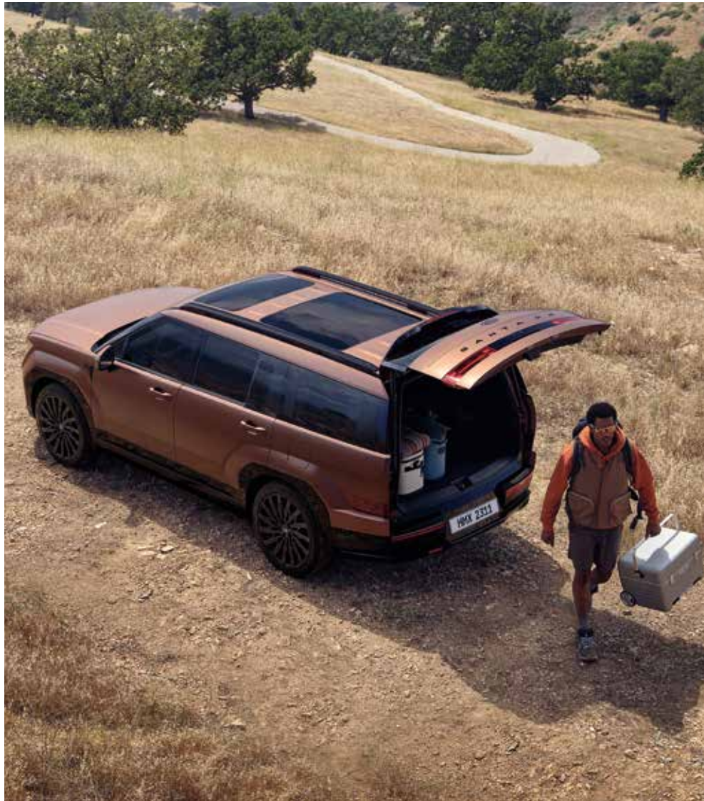
Strešni nosilci / Dvojna sončna streha

Dvignite široka prtljažna vrata in povežite notranjost z zunanostjo ter razširite svoje vsakodnevne izkušnje.