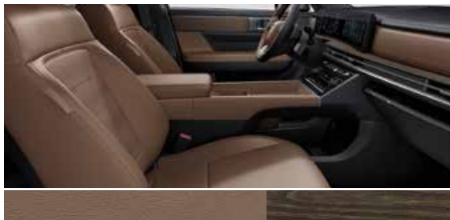
Pecan rjavo nappa usnje / barva naravnega hrasta