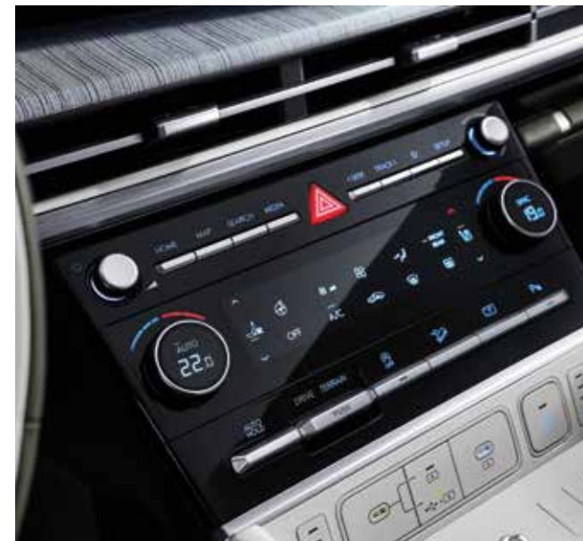
Zaslon za upravljanje dvoconske klimatske naprave