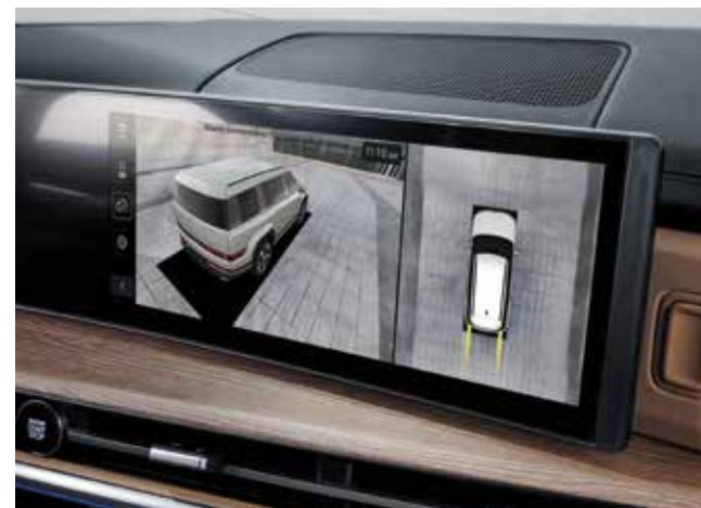
Sistem kamer za 360° pogled okolice vozila (SVM)