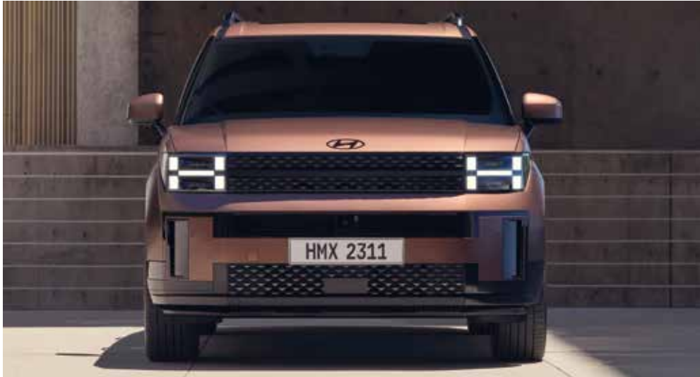
Matrični LED žarometi v obliki črke H

Elegantno robusten z vseh zornih kotov, SANTA FE izstopa edinstvenim svetlobnim podpisom v obliki črke H, ki doda edinstven pečat drzno oblikovani, a brezhibni karoseriji.