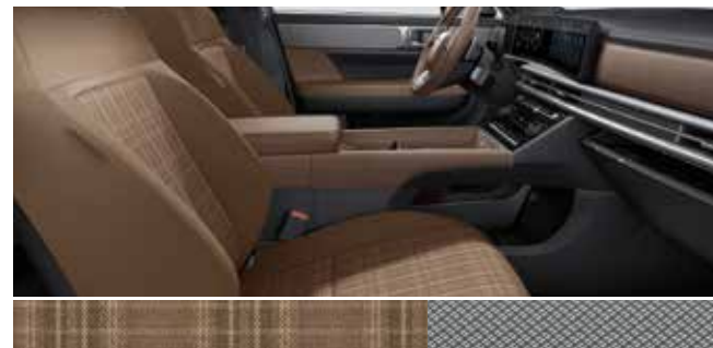
Pecan rjavo blago / barva kovine