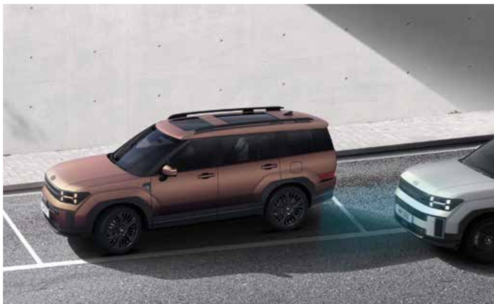
Aktivni sistem za nadzor območja mrtvih kotov (BCA)