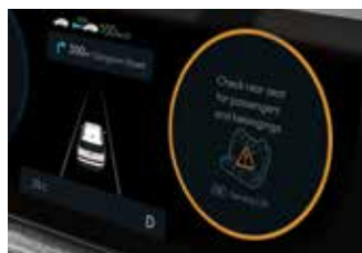
Slikovni prikaz območja mrtvega kota v instrumentni plošči (BVM) Sistem za opozarjanje na prisotnost potnikov na zadnjem sedežu (ROA)