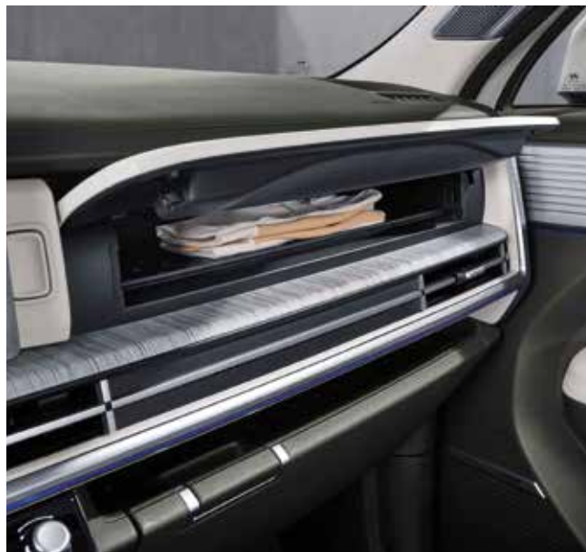
Pedal za dezinfekcijo