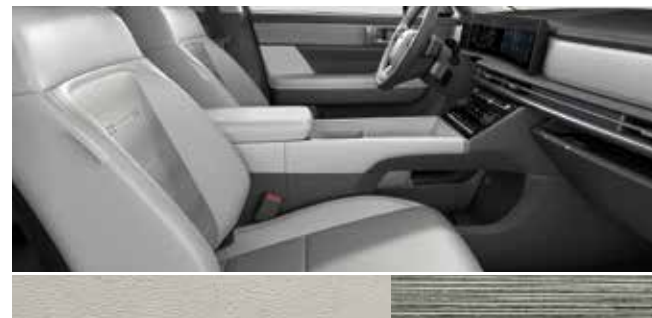
Forest zeleno nappa usnje / barva svetlega evkaliptusa