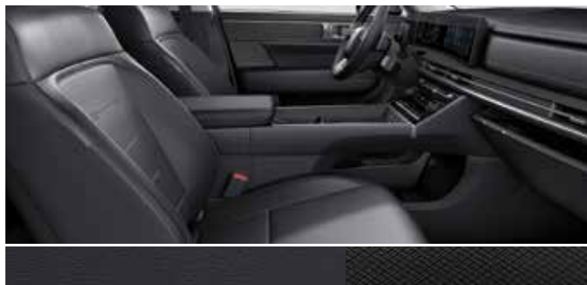
Črno enobarvno nappa usnje / barva črne kovine