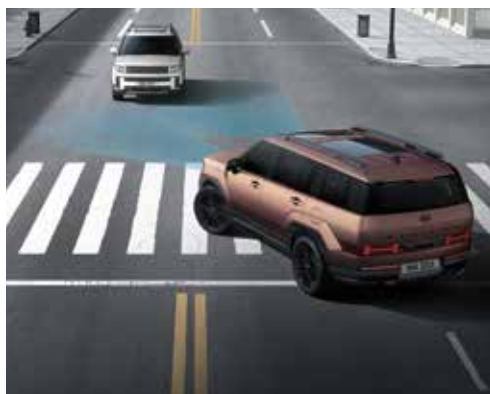
Radarski sistem za preprečevanje naleta s prepoznavanjem vozil, pešcev in kolesarjev ter asistentom za križišča in izogibanjem oviram na vozni pasu (FCA 2)