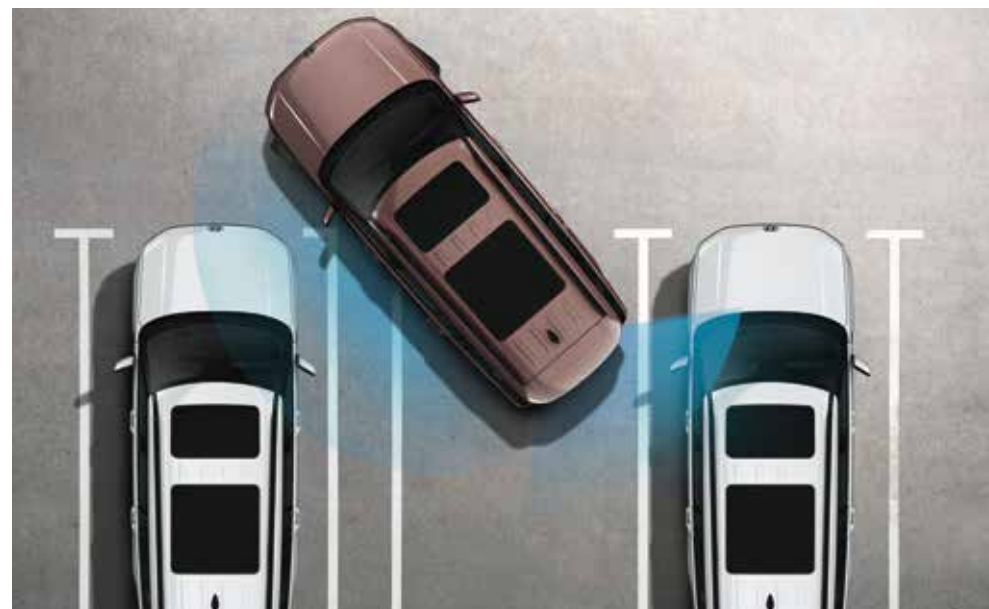
Pomočnik za parkiranje (PDW)

*Napredni sistemi za pomoč voznikom (ADAS) so namenjeni zagotavljanju pomoči pri upravljanju vozila, zato morajo vozniki ves čas voziti previdno. *Funkcije morda ne bodo delovale, odvisno od okolice in voznih razmer. Za podrobnejše informacije glejte navodila za uporabo. *Dejanske specifikacije se lahko razlikujejo glede na izbrano opremo, pogonski sklop in specifikacije.