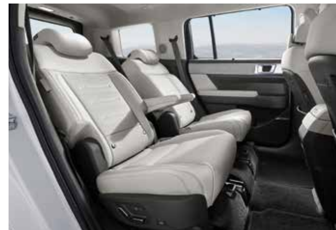
Električno nastavljiva ločena sedeža v 2. vrsti (6-sedežni) Enostavno vstopanje