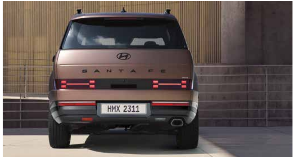
Zadnje kombinirane LED luči