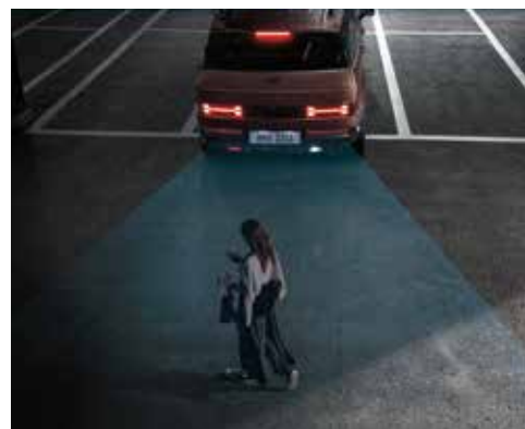
Sistem za preprečevanje trka pri parkiranju (PCA)