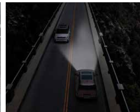
Sistem za samodejni vklop in zasenčenje dolgih žarometov (HBA)