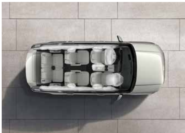
10 zračnih blazin

Najnovejše izboljšave na področju varnosti bodo poskrbele, da bodo vaši najbližji varni tako v vsakodnevni kot nepričakovanih situacijah.