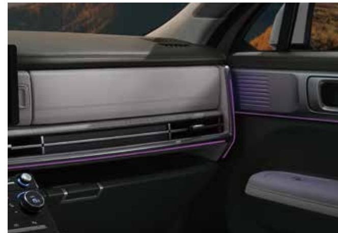
Ambientalna osvetlitev Usnjeni sedeži