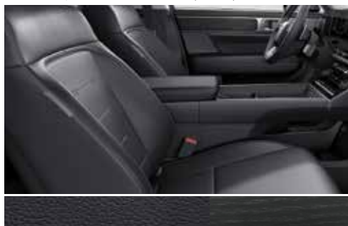
Črno enobarvno usnje / barva črnega hrasta