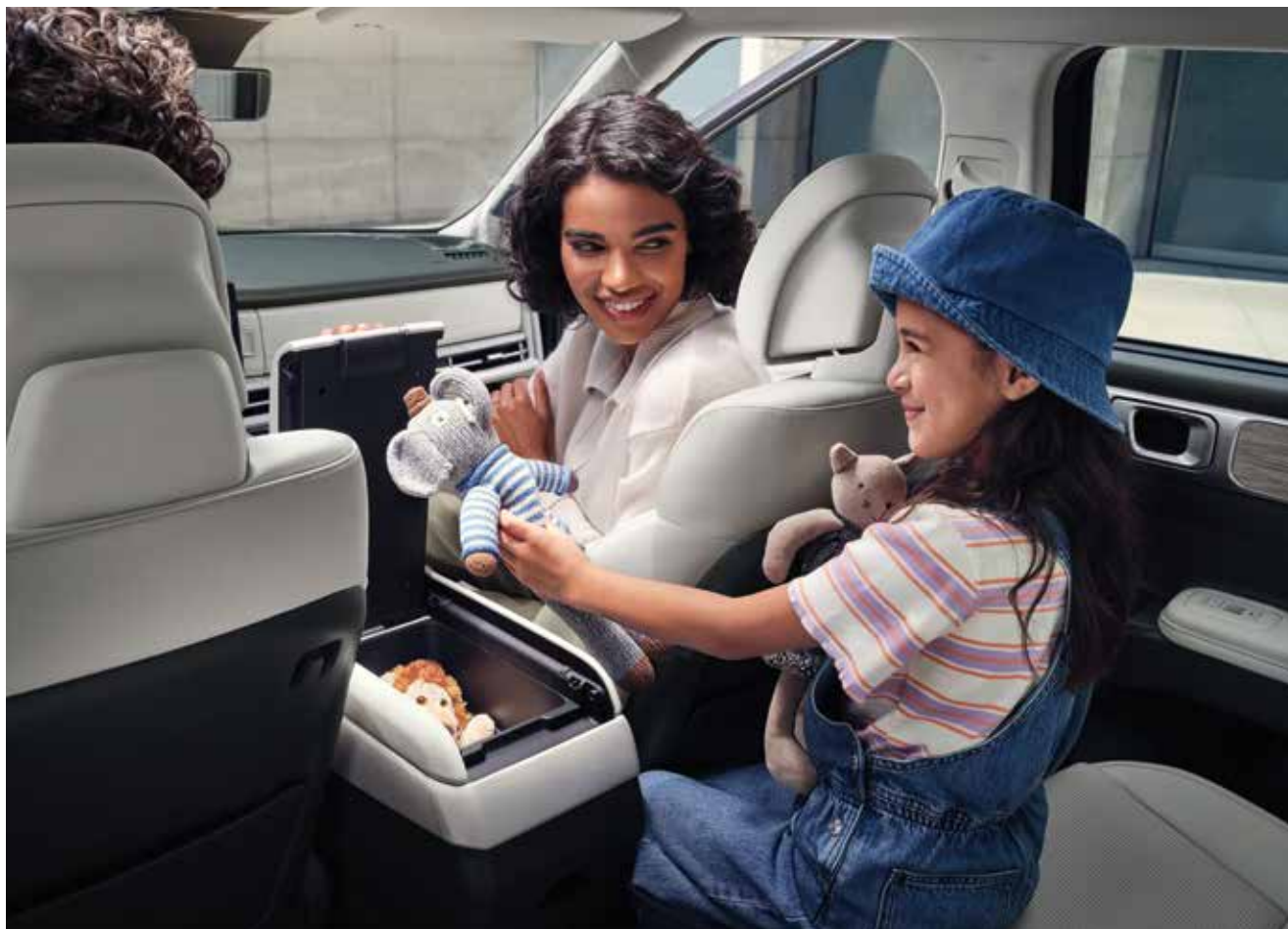
Večnamenska obojestranska sredinska konzola

Številni prostori za shranjevanje so skrbno načrtovani in strateško razporejeni za nadgradnjo vašega potovanja.