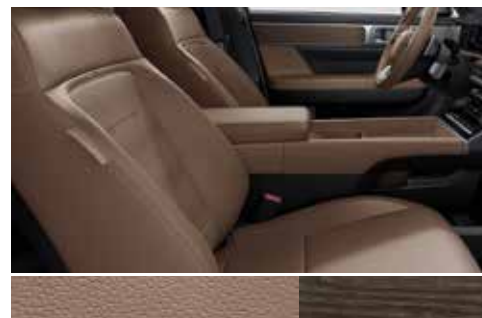
Pecan rjavo usnje / barva naravnega hrasta