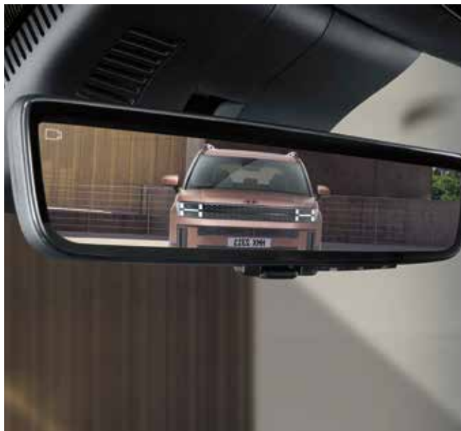
Digitalno ogledalo (ogledalo za vzvratno vožnjo)