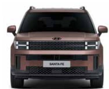
Kolotek spredaj Širina 1.643 1.900