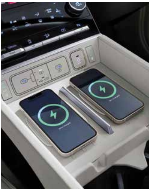
Dvojna površina za brezžično polnjenje