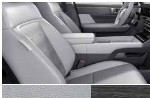
Supersonic sivo usnje / barva sivega hrasta