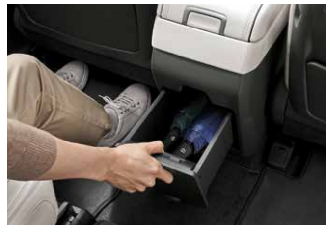
Predal za shranjevanje zgoraj