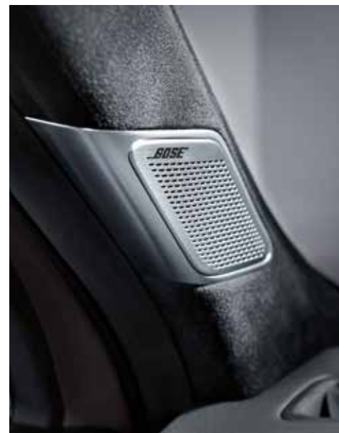
Zvočni sistem BOSE