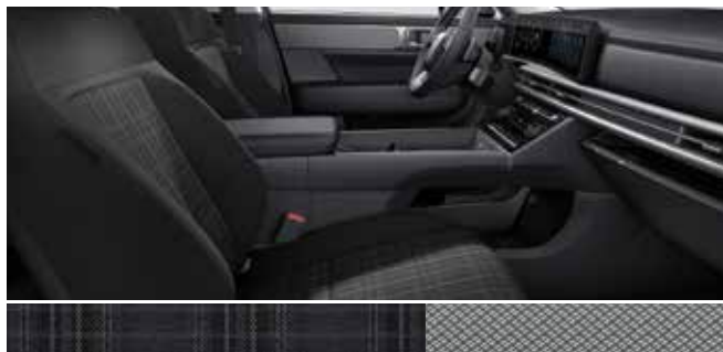
Črno enobarvno blago / barva kovine