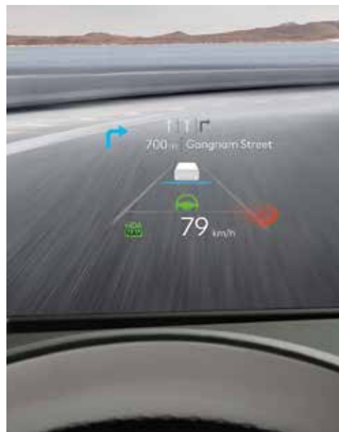
12-palčna projekcija na vetrobransko steklo (HUD)