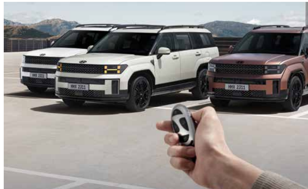
Inteligentni sistem za parkiranje na daljavo (RSPA)