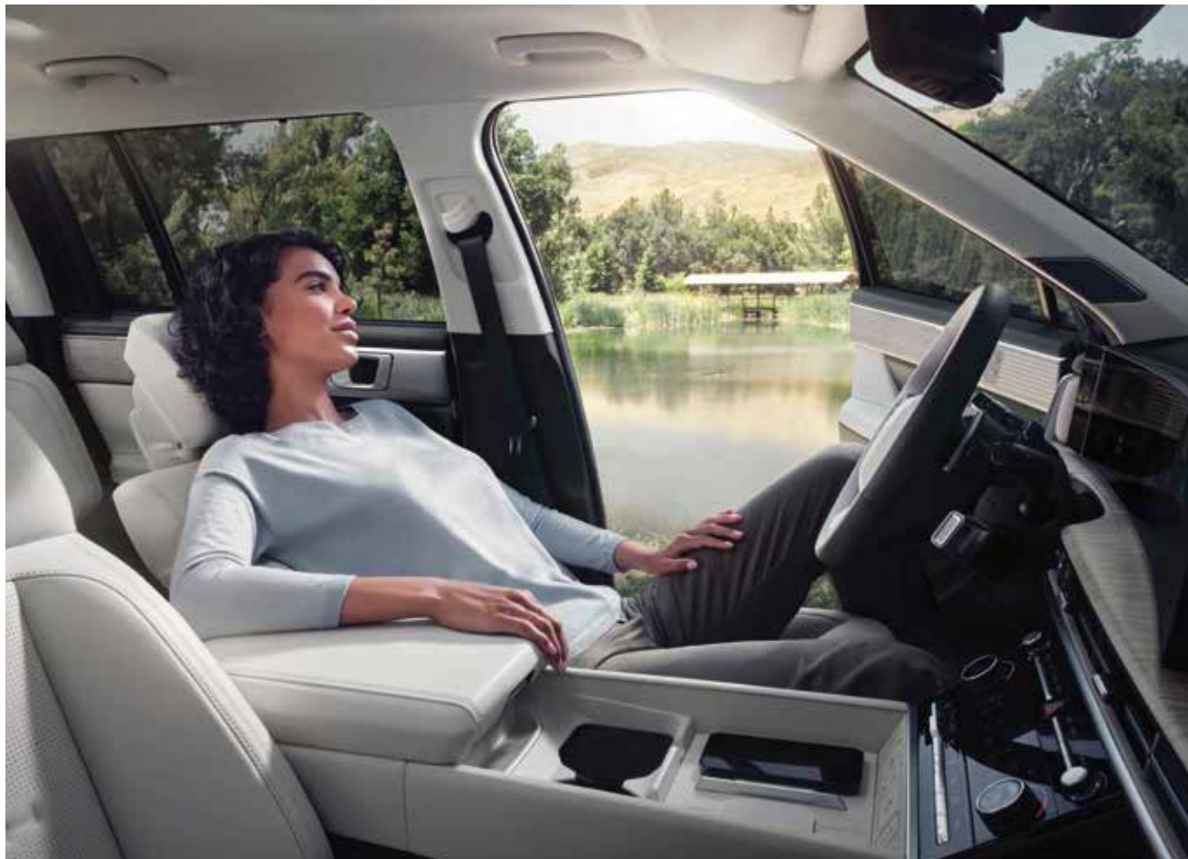
Sprednja sprostivna sedeža z naslonjalom za noge

Uravnotežena notranjost je zasnovana tako, da ustvarja pomirjujoč in sproščen ambient ter zagotavlja izjemno udobje.