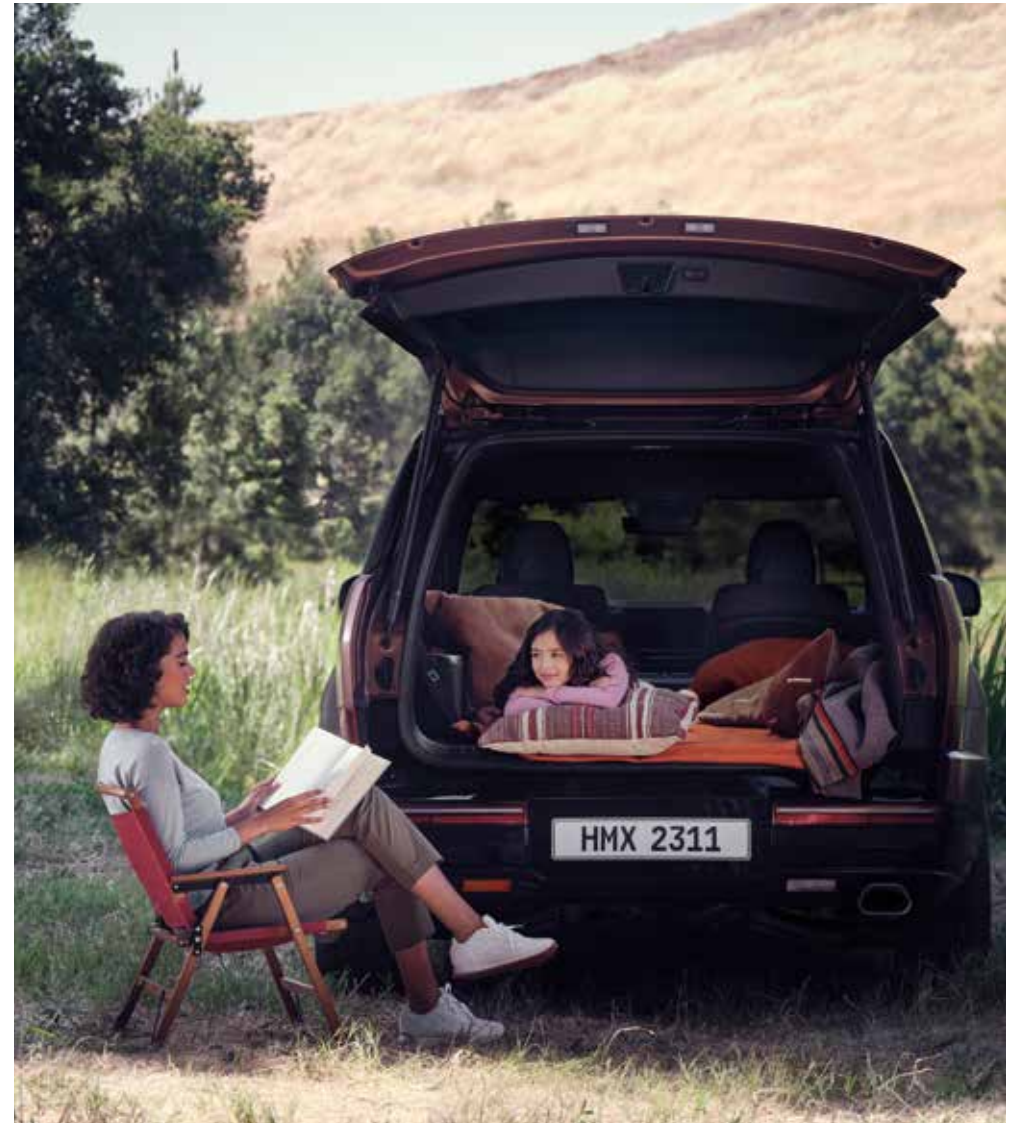
Široko odpiranje prtljažnih vrat (električno odpiranje)