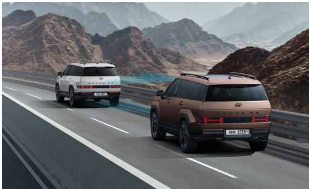
Radarski sistem za prednastavitev hitrosti z nastavitvijo razdalje do spredaj vožečega vozila (SCC)