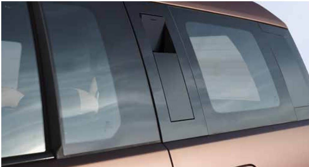
Skriti pomožni ročaj / Povečano zadnje stransko steklo