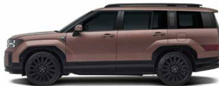
Medosna razdalja Dolžina 2.815 4.830

Višina (vključujoč vzdolžne nosilce za strešni prtlačnik)