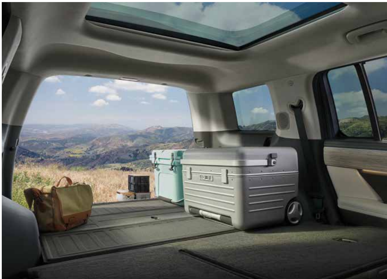
Zložljivi sedeži 2. vrste (ravno dno)