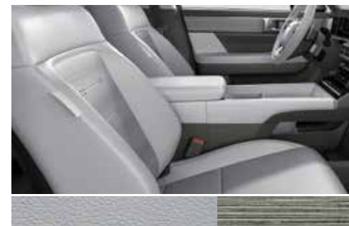
Forest zeleno usnje / barva svetlega evkaliptusa