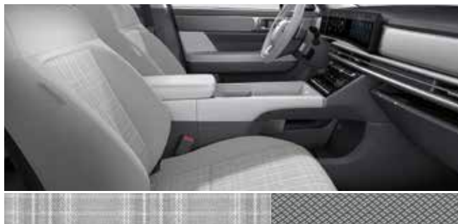
Supersonic sivo blago / barva kovine