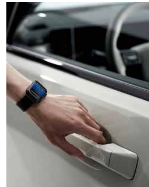
Digitalni ključ 2