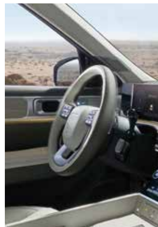
Haptični volanski obroč