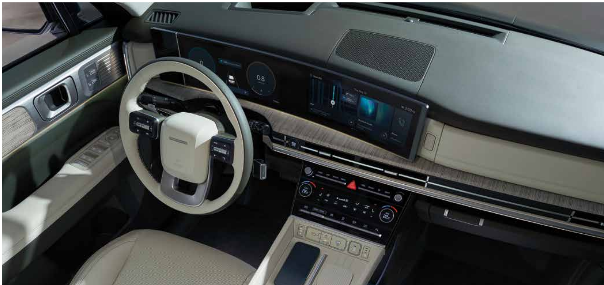
Ukrivljen panoramski panel z 12,3- palčnim zaslonom merilnikov in 12,3-palčnim zaslonom infotainmenta