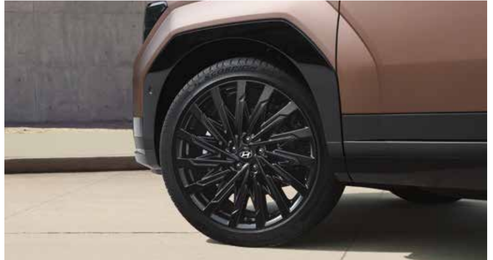
21-palčna aluminijasta platišča / ostro oblikovana blatnika