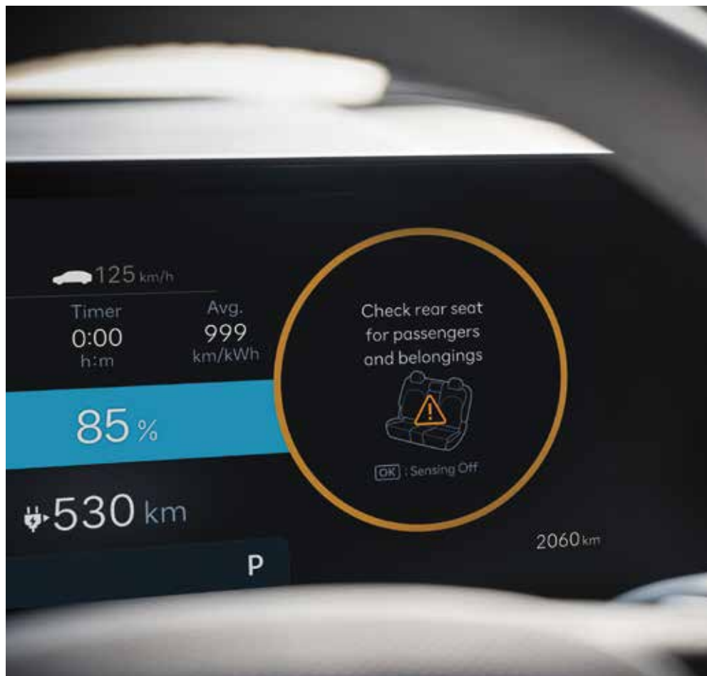
Sistem za opozarjanje na prisotnost potnikov na zadnjem sedežu (ROA)