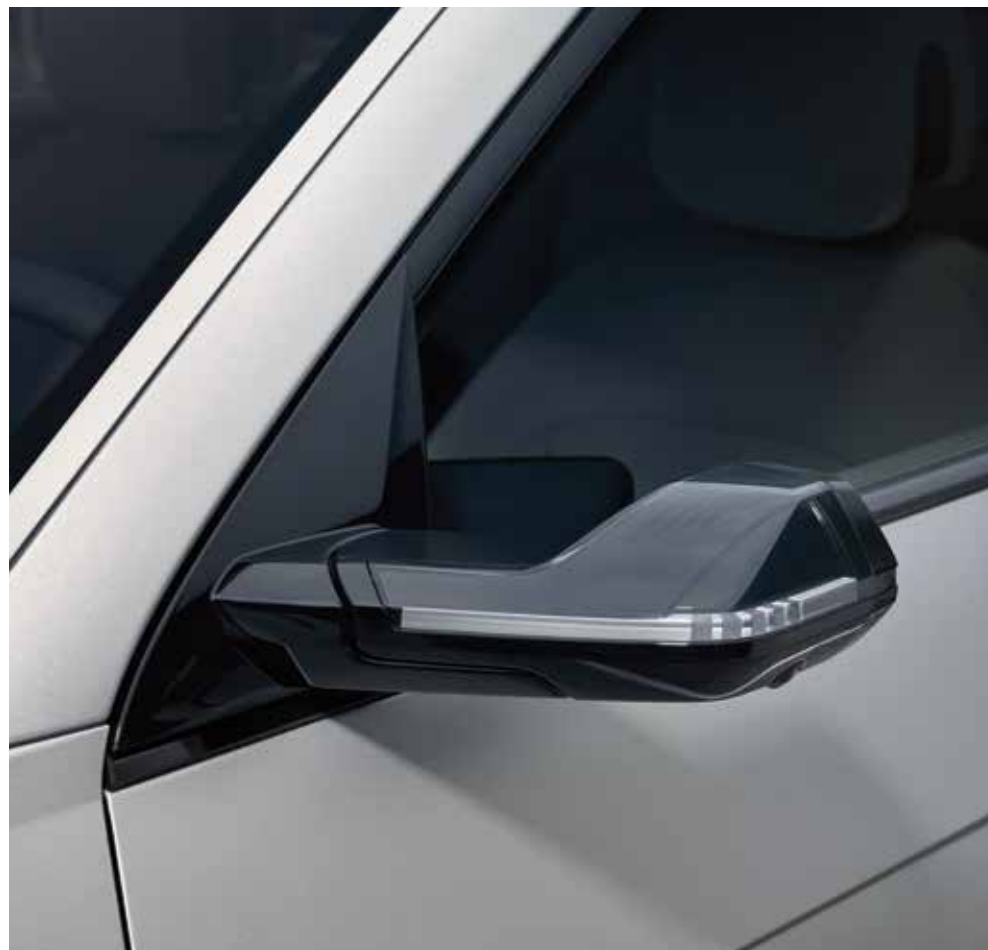
Aerodinamični digitalni stranski ogledali (DSM)