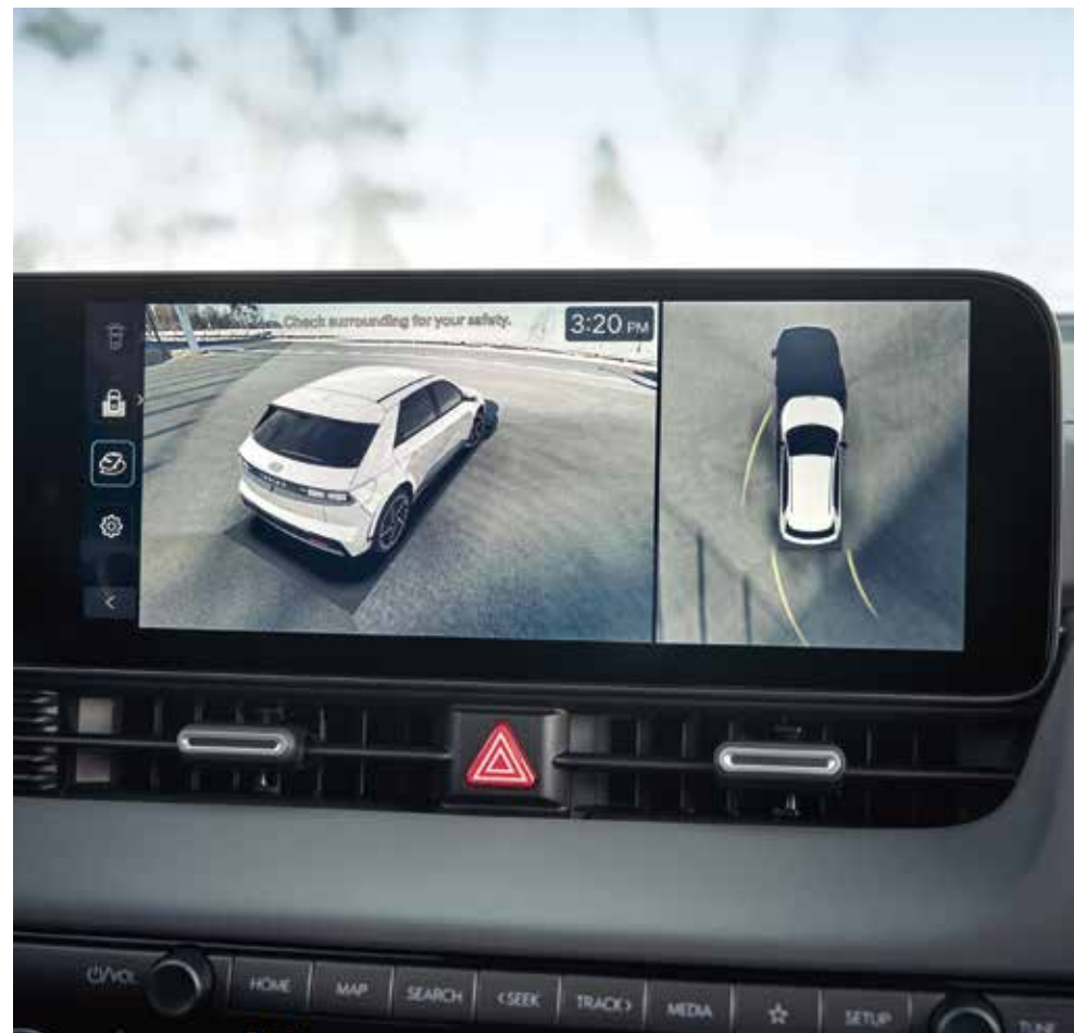
Sistem kamer za 360° pogled okolice vozila (SVM)