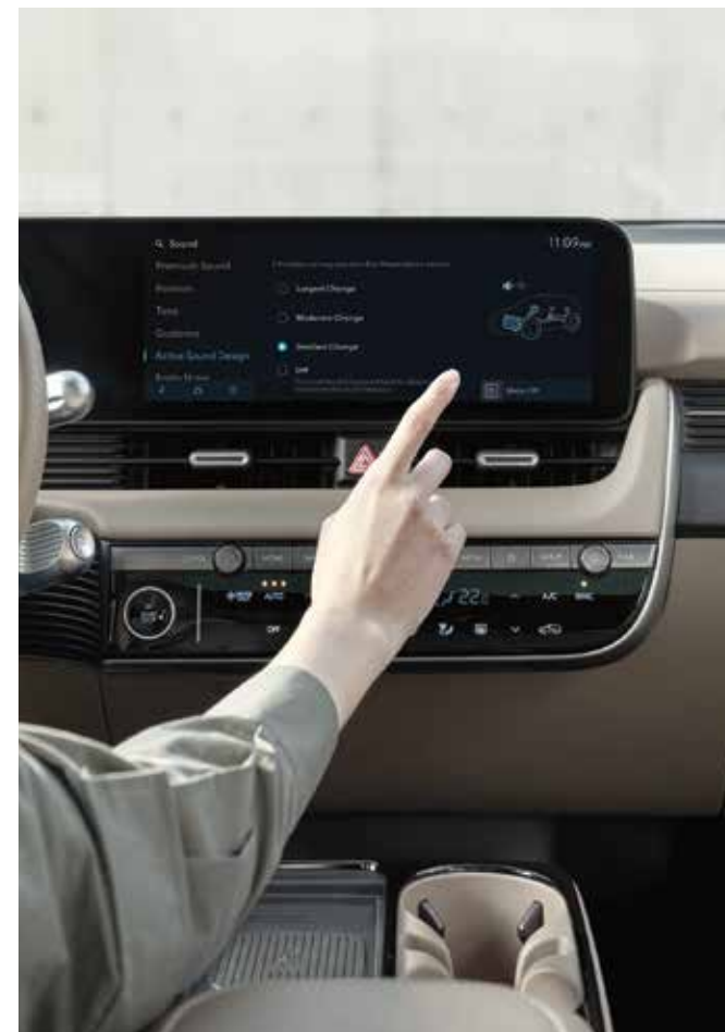
Sistem za generiranje zvoka (e-ASD)