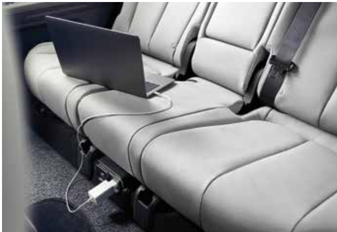
Digitalni ključ 2 Tehnologija Vehicle-to-Load (vtičnica v notranjosti)