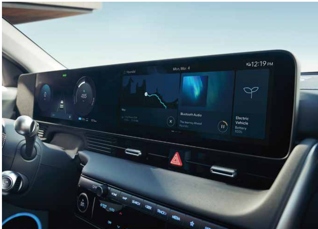
12,3-palčna zaslona infotainment sistema in instrumentne ploče