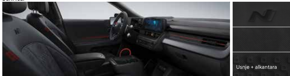
N Line ekskluzivna črna (z rdečimi dodatki)