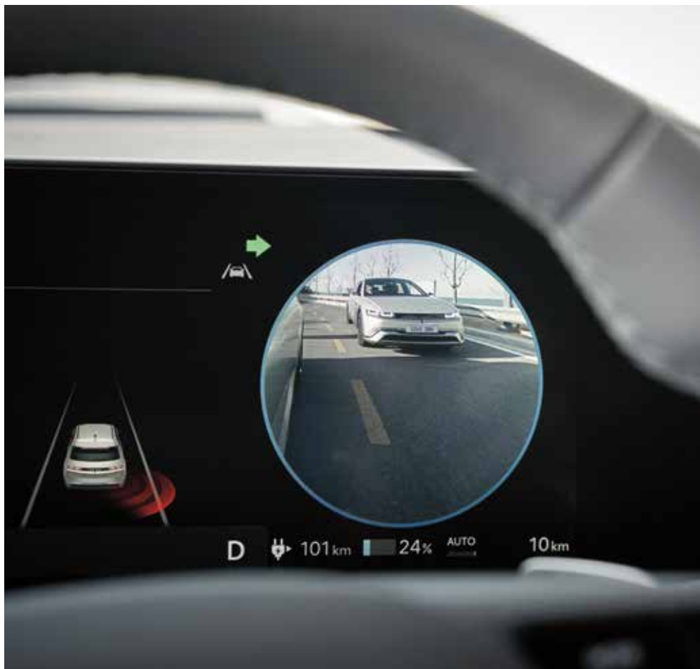
Slikovni prikaz območja mrtvega kota na instrumentni plošči (BVM)

Opremljen je z naprednimi tehnologijami, ki vas opozarjajo na nevarnost in vam zagotavljajo bolj sproščeno in varno vožnjo.