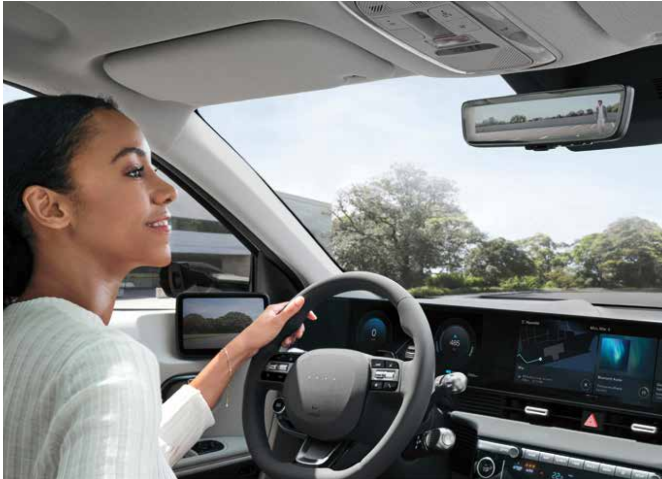
Digitalno ogledalo (ogledalo za vzratno vožnjo)

Z inovativnimi funkcijami za večanje udobja vam IONIQ 5 omogoča, da se brezskrbno osredotočite na svojo pot.