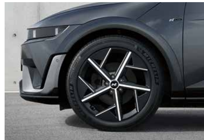
N Line ekskluzivna 20-palčna platišča N Line ekskluzivni aerodinamični športni elementi zadnjega odbijača in zaščitne plošče