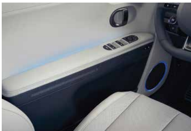
Interaktivne slikovne točke na volanu (□ Zagon / ▽ Vzvratio / ● Polnjenje) Ambientna osvetlitev