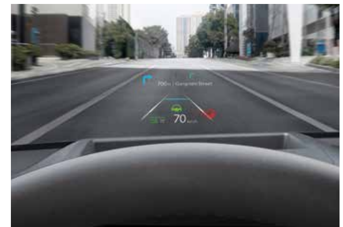
Posodobitve na daljavo (OTA)