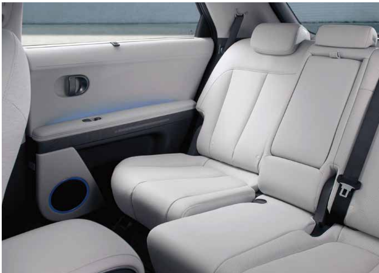
Električno pomični sedeži 2. vrste