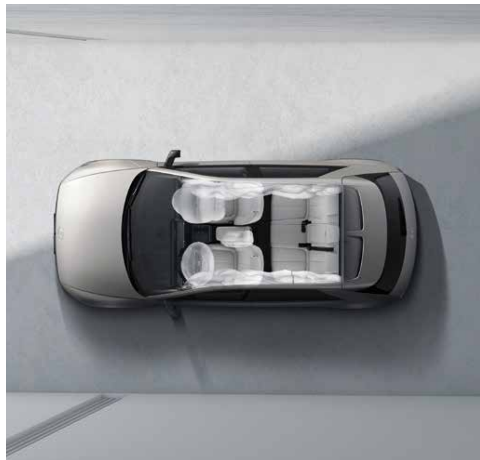
7 zračnih blazin