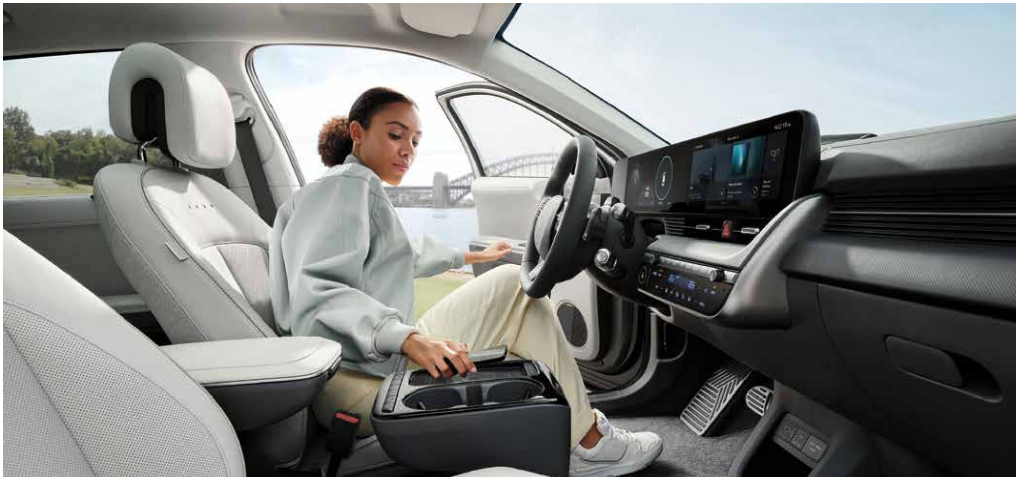
Univerzalni otok (premična sredinska konzola) / Površina za brezžično polnjenje

V kabini IONIQ 5 se meje med vozniškim in bivalnim prostorom razblinijo. Opremljena je z inovacijami, ki še dodatno povečujejo udobje.