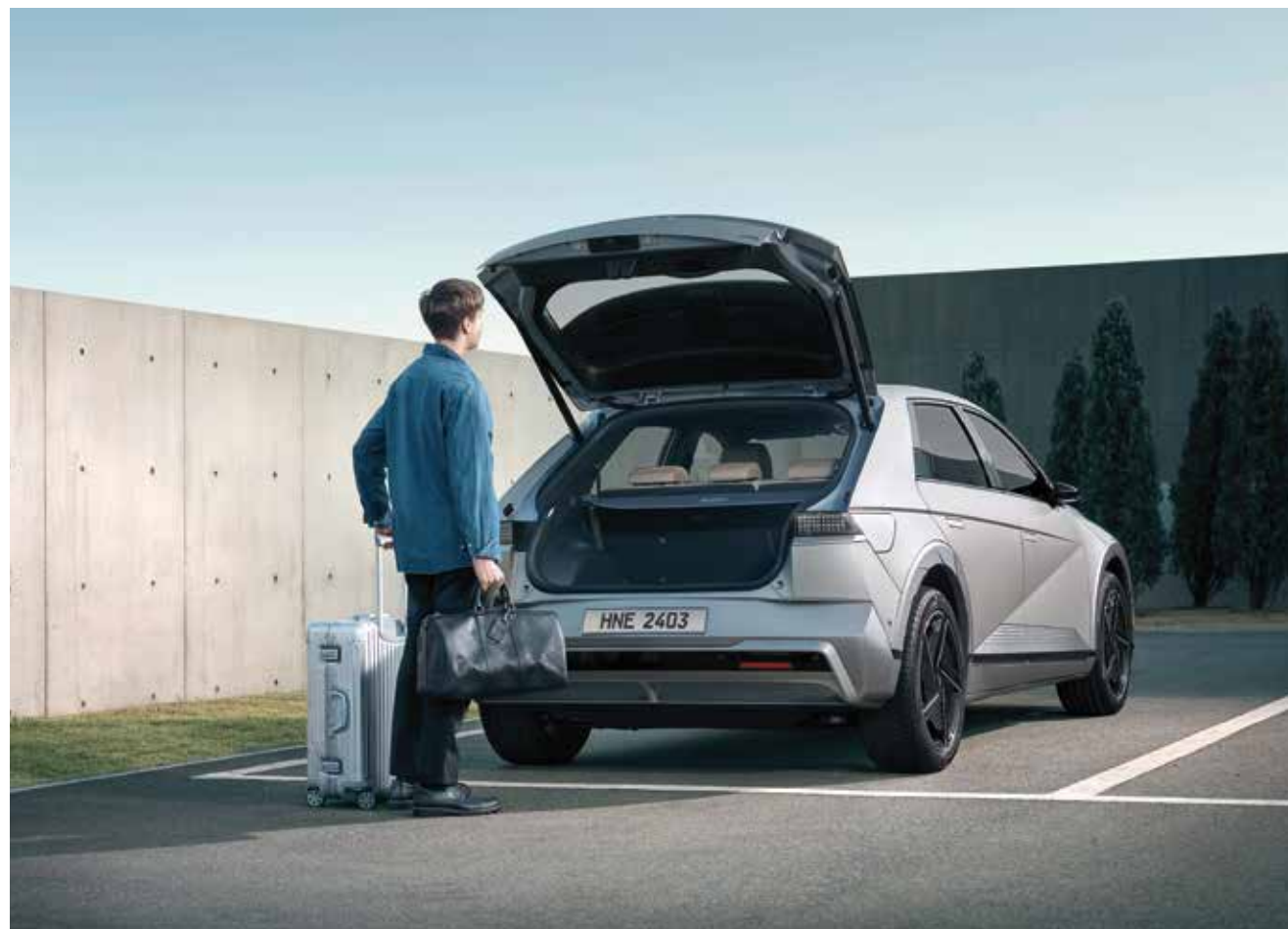
Eklektična pomična vrata prtljavnika s funkcijo samodejnega odpiranja