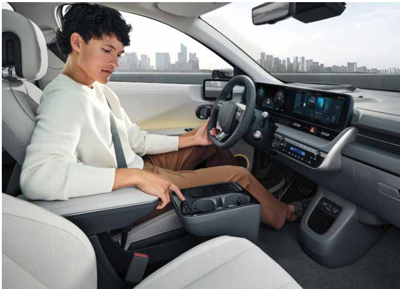
Ogrevana in prezračevana sedeža spredaj (fizični gumb)

IONIQ 5 je zasnovan tako, da podpira vaš vsakdan, saj združuje sodobne digitalne funkcije in praktičnost za enostavno in udobno uporabo.