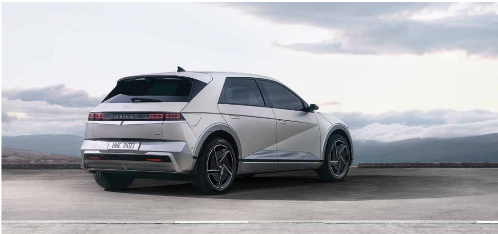
Širok zadnji odbijač in zaščita / LED zadnje kombinirane luči

Inovativno zasnovano LED osvetlitve z značilnimi parametričnimi slikovnimi točkami je mogoče najti tudi zadaj, medtem ko zadnji spojler dodaja pridih elegance.