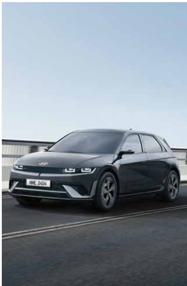
N Line ekskluzivni aerodinamični športni elementi Sprednji odbijač in zaščitna plošča

Zasnovan za tiste, ki si želijo vznemirljive vožnje, IONIQ 5 N Line izžareva svojo dinamičnost že, ko stoji na mestu.