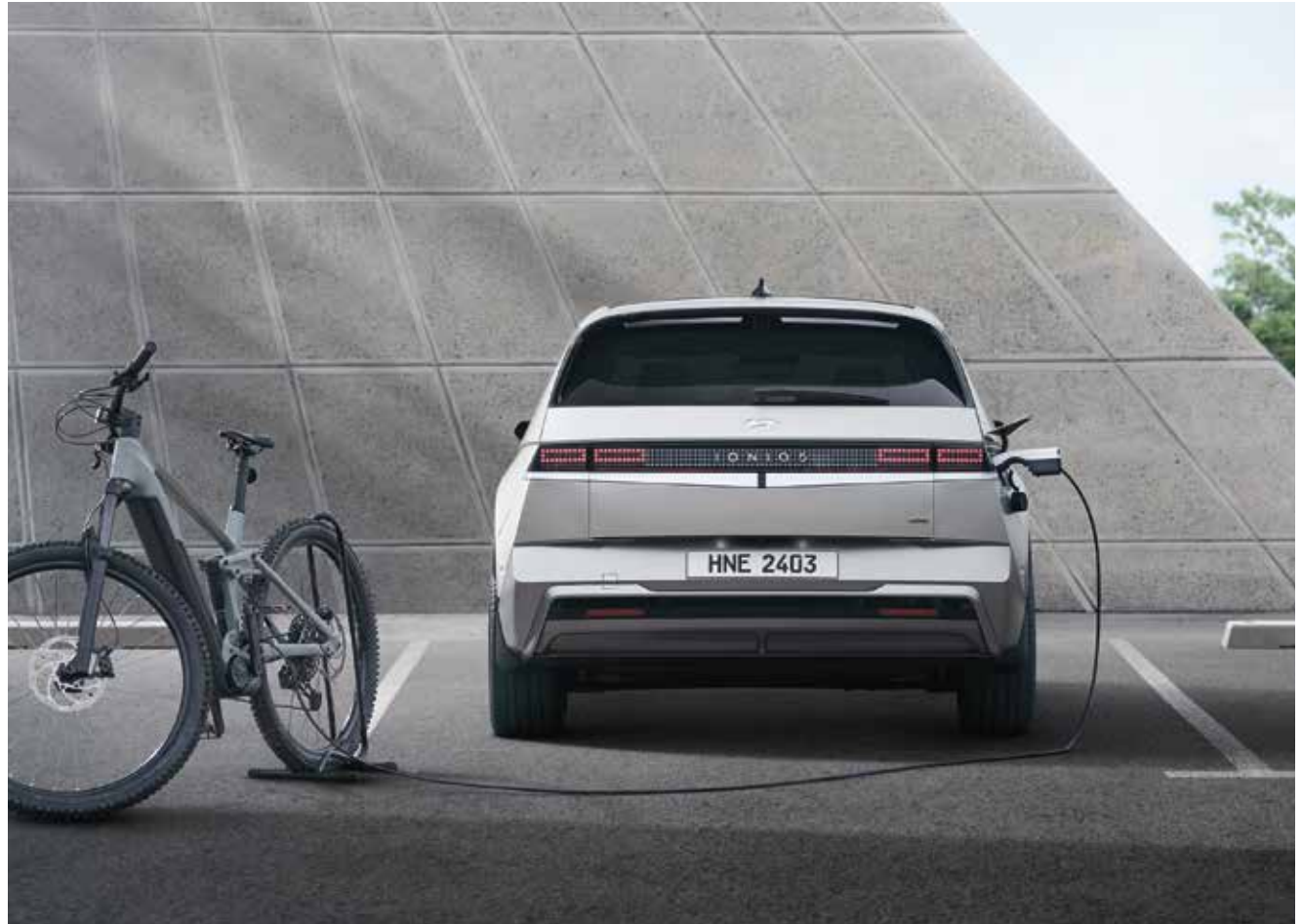
Tehnologija Vehicle-to-Load (zunanja enota)