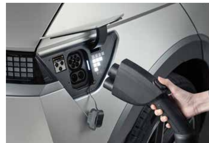
Priključi in polni