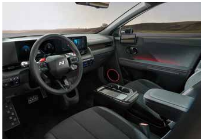
N Line ekskluzivni volanski obroč / Kovinski pedali N Line ekskluzivni športni sedeži z logotipom N / Rdeči šivi v notranjosti