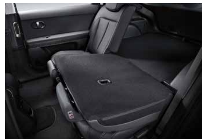
Integrirani spominski sedež Enostavno zlaganje sedežev 2. vrste