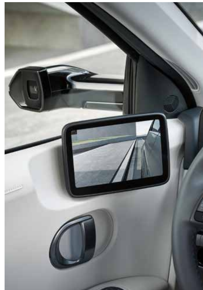
Digitalni stranski ogledali (DSM)