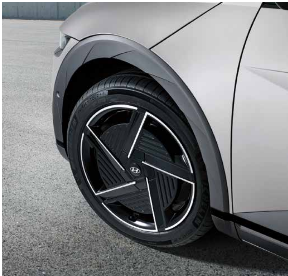
20-palčna aluminijasta platišča