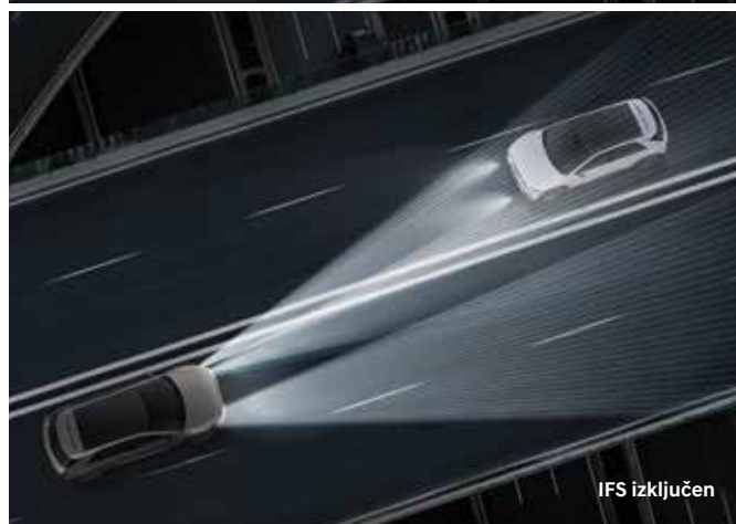
Matrični LED žarometi (IFS)