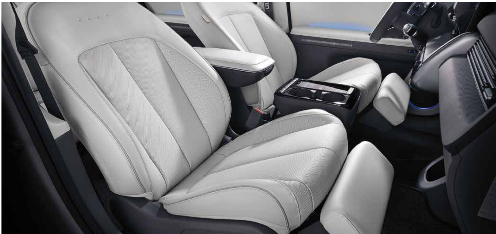
Prednja relaksacijska sedeža

Izboljšane tehnologije, skrite pod vrhunskimi materiali, in preprosta zasnova zagotavljajo udobje in vsestranskost.