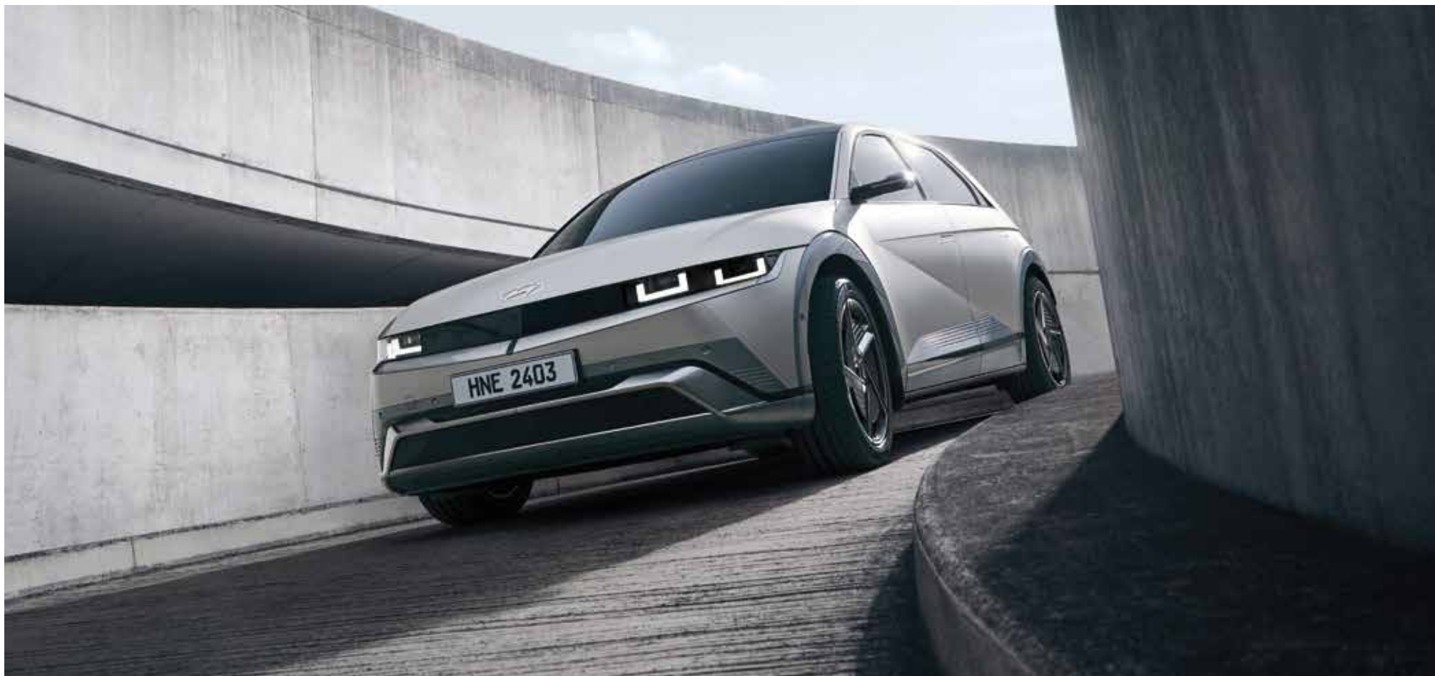
Širok sprednji odbijač in zaščita / LED žarometi (projekcijski tip)

Vsak del IONIQ 5 je skrbno izpopolnjen, vključno z detajli platišč, kar krepi njegov ikonični dizajn in izboljšuje aerodinamiko.