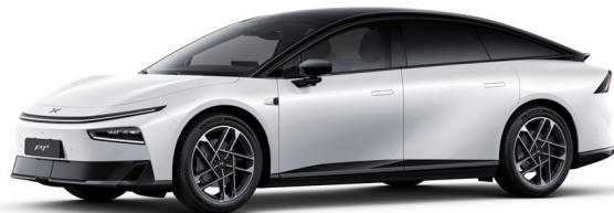
Arctic bela 0 EUR