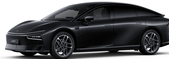
Midnight črna 1 050 EUR