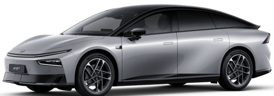
Frost srebrna 1 050 EUR