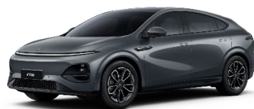
Graphite siva 550 EUR