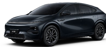
Midnight črna 550 EUR