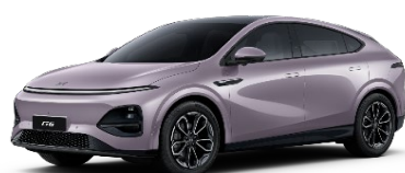
Stellar vijolična 550 EUR