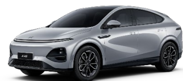
Frost srebrna 550 EUR