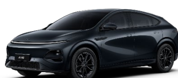
Black Edition paket [v primeru Performance različice]