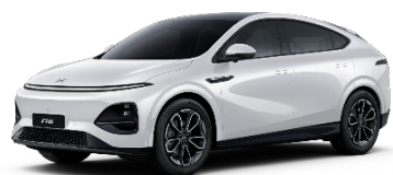
Arctic bela 0 EUR